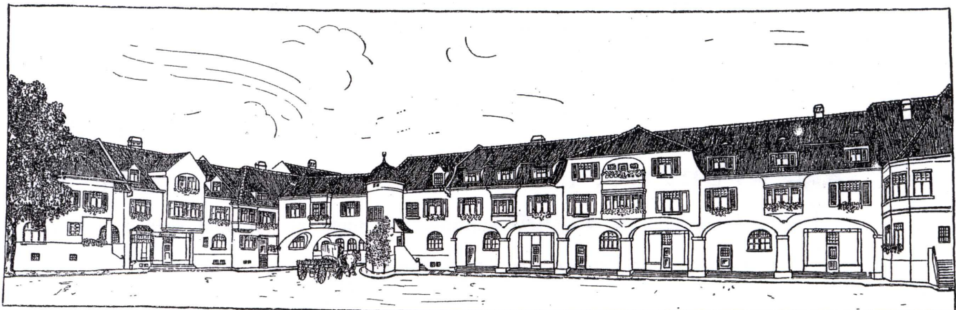
Parto de unu el tri komercaj distriktoj.

kaj (kiu scias?) eble vi estas tiu feliĉulo, kiu gajnos la domon en Parkurbo! . . .