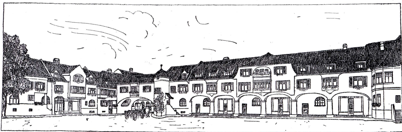
Teil-Ansicht eines Geschäftsviertels in der Parkstadt Esperanto.

Der Preis eines jeden Losbriefes beträgt M. 1.—.